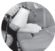
ルームクリーニング