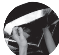
ウインドウフィルム