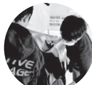
ラッピングフィルム