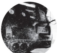
洗車・コーティング