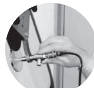
ウインドウリペア